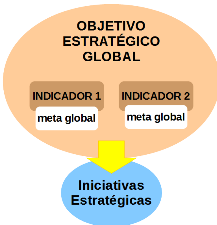
Figura 3.2: Estrutura do objetivo estratégico

Os objetivos estratégicos devem ser acompanhados de indicadores, metas e iniciativas estratégicas.