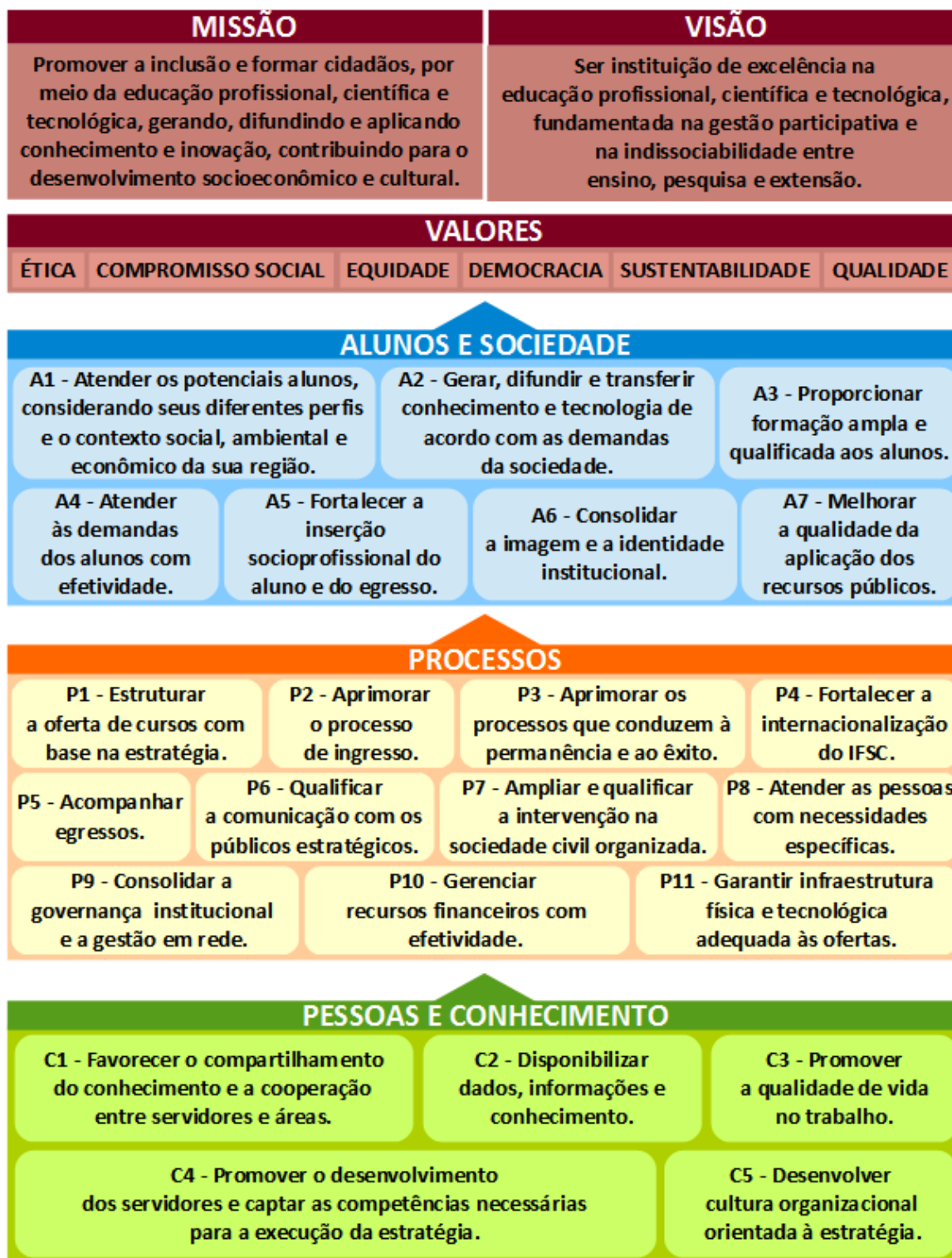
Figura 3.1: Mapa estratégico do IFSC